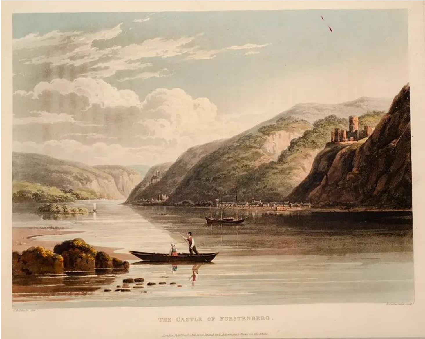
THE CASTLE OF FURSTENBERG.

London, Pub. by T. Agnew & Sons, Strand, for E. Colnaghi & Co., Pall Mall.